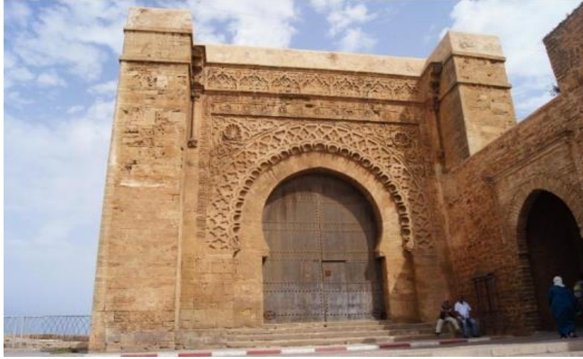
لوحة رقم (2) قصبة الأوداية البوابة الرئيسية عامر عجلان انظر لوحة رقم 72 من رسالة دكتوراة القصاب الباقية بالأندلس والمغرب الأقصى