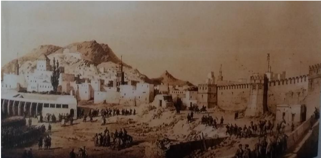
لوحة رقم (3) منظر عام لمدينة تطوان العتيقة سنة 1800م محمد حسن عبد الفتاح - العمارة الدينية في مدينة تطوان، ص34