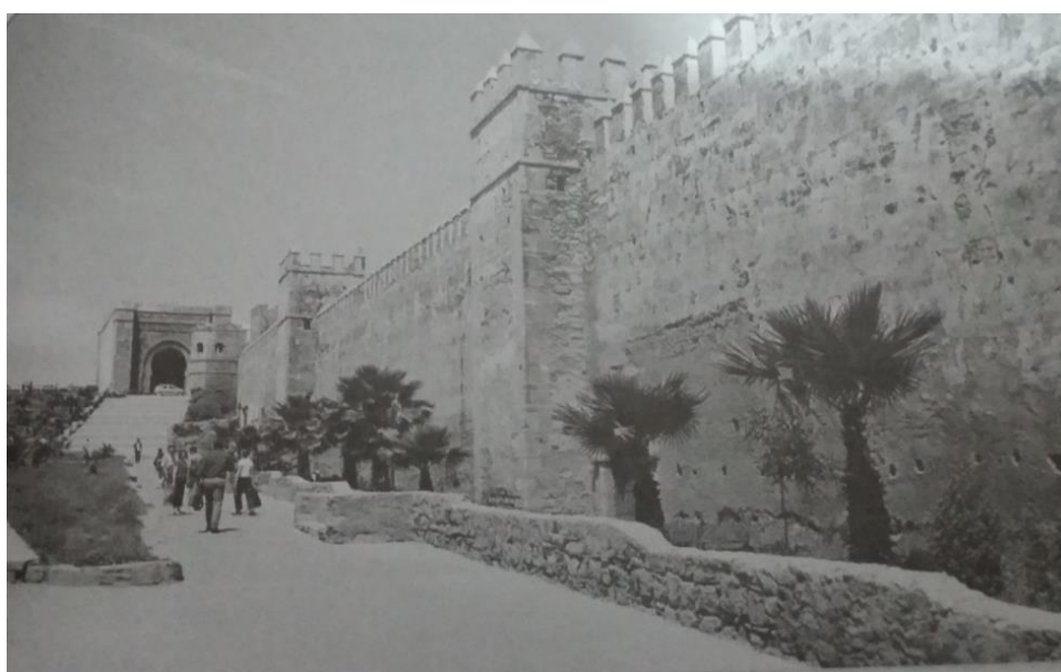
لوحة رقم (1) السور الشرقي لقصبة الأوداية عبد العزيز صلاح سالم - الآثار الإسلامية في مدينتي سلا ورباط الفتح، ص 402