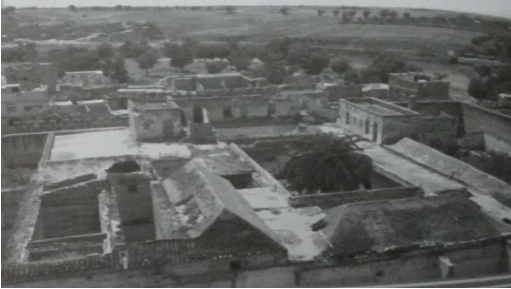
لوحة رقم (5) القصر السلطاني وملحقاته بقصبة تادلة مريم بوزكراوي - الأدوار التاريخية والمقومات التراثية للقصبات العسكرية القصبة الإسماعيلية بتادلة، ص65