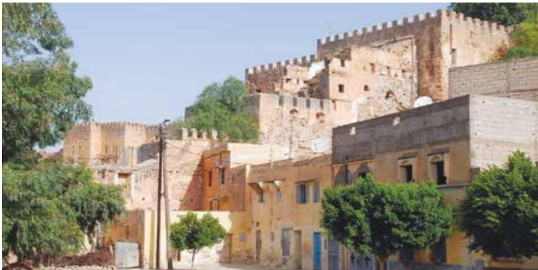
لوحة رقم (4) قصبة تادلة محمد القاضي - القلاع والقصبات في المغرب، ص173