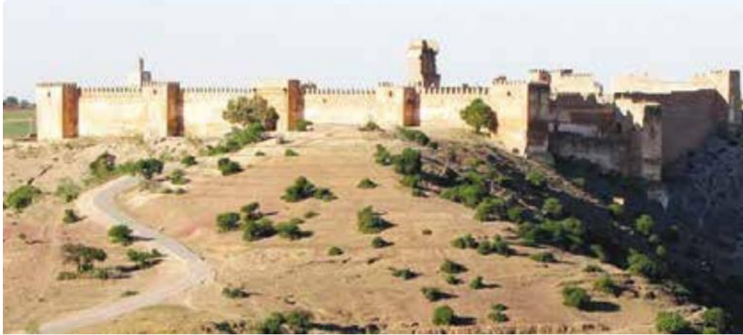
لوحة رقم (6) قصبة بولعوان محمد القاضي - القلاع والقصبات في المغرب، ص174